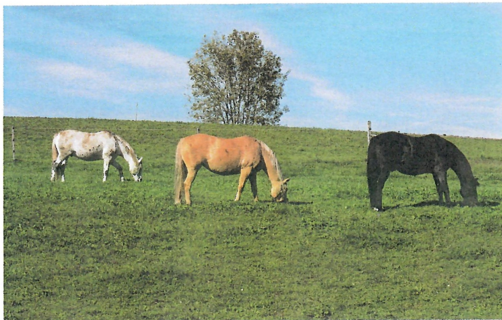
Während der Weidezeit sind die Pferde auf der Weide anzutreffen.

Auch für die Pferdebesitzenden ist gesorgt. Im Reiterstübli können sie sich austauschen und sich am Snack-Angebot bedienen, wobei am Ende des Monats abgerechnet wird. Ausserdem bekommt jede Besitzerin und jeder Besitzer pro Pferd ein Abteil für Sattelzeug und anderes Zubehör zur Verfügung gestellt.