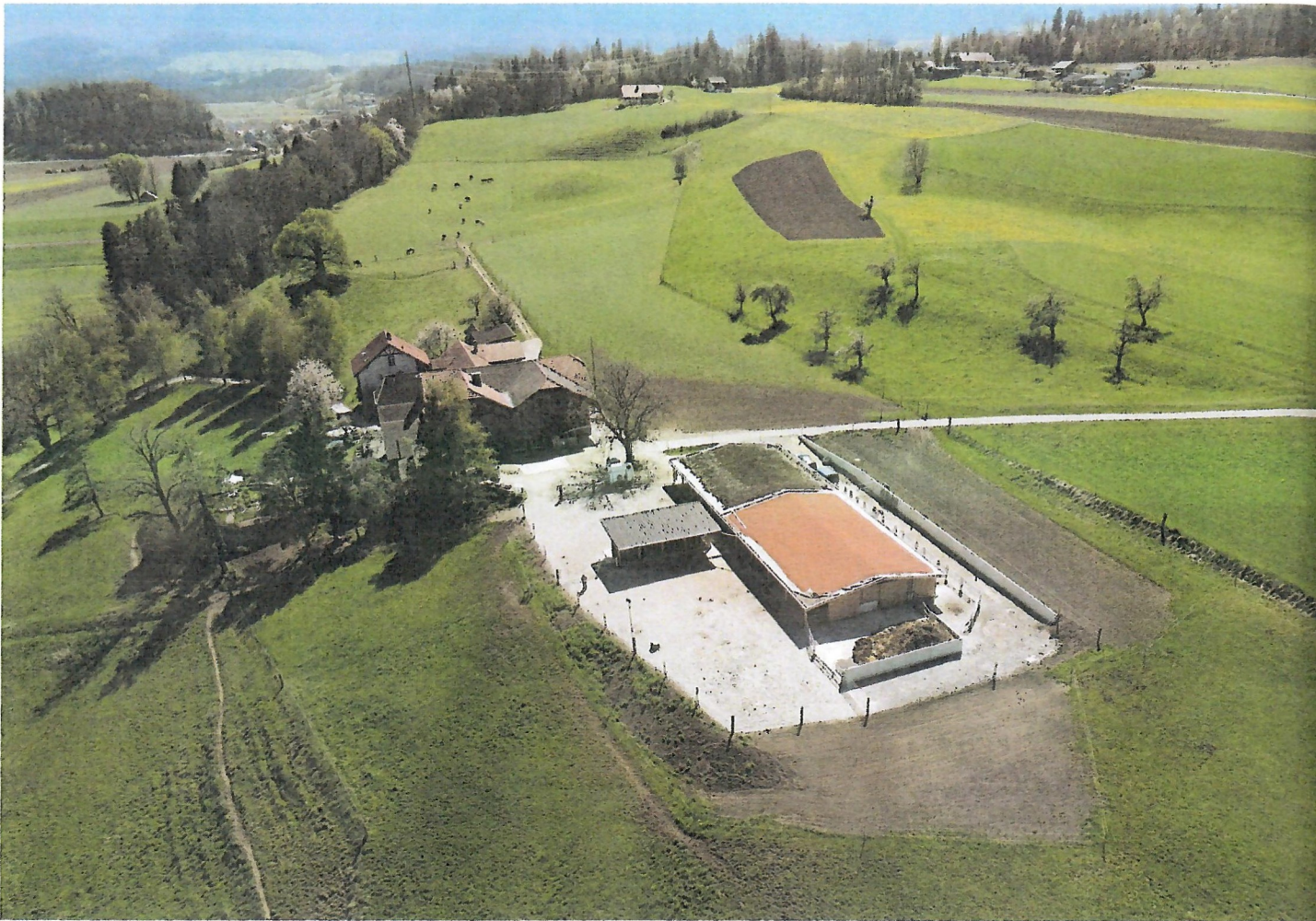
Der Hof in Uetendorf aus der Vogelperspektive.

und dann kann er nur noch eingeschränkt benutzt werden.» Eveline ergänzt: «Für uns kommt nur ein Naturprodukt infrage – kein Textilgemisch. Das Ganze ist aber auch eine Kostenfrage.»